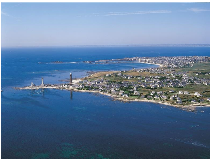
Pointe de Penmarc'h

La pointe de Penmarc'h marque le coin Sud-Ouest du Finistère. A cet endroit les navigateurs infléchissent leur route pour longer la côte sud Bretagne et se diriger vers la Gironde.