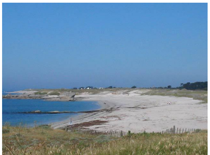
Plage près de Lesconil.

La côte bigoudène est plate, elle est jalonnée de plages et de bandes rocheuses. Il est souvent facile d'y accoster.