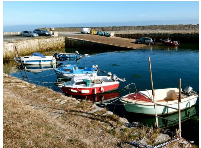
Grande cale du port

Situé entre deux pointes rocheuses appelées "les Becquets", le port fut construit en 1783. En 1785, il était le principal lieu d'embarquement des pierres que l'on extrayait des carrières du Becquet toutes proches, destinées à la construction de la grande digue de la rade de Cherbourg.