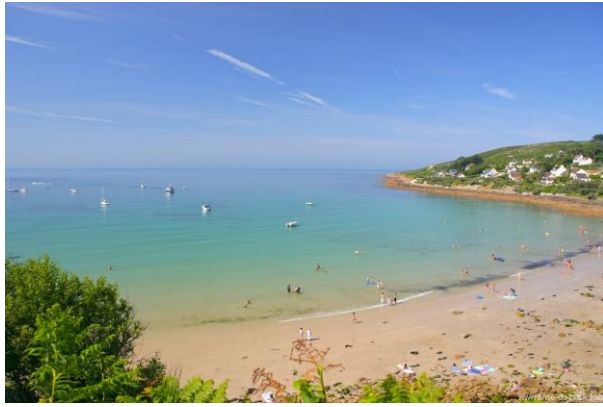
Anse du Brick