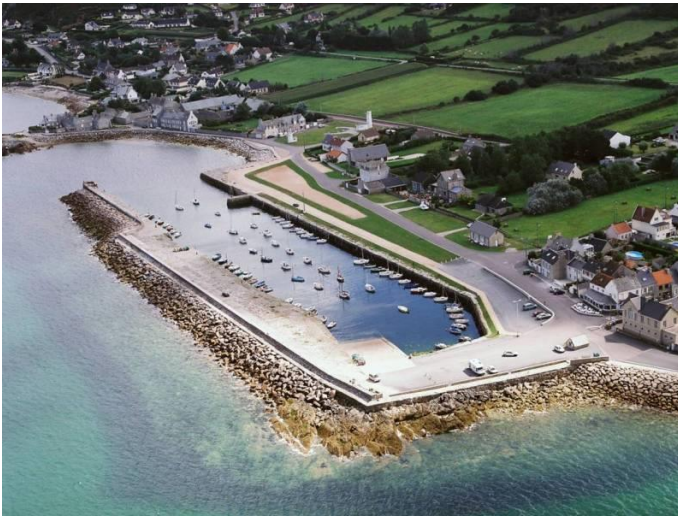
Le port du Becquet

La mise à l'eau se fait au port du Becquet, à Tourlaville.