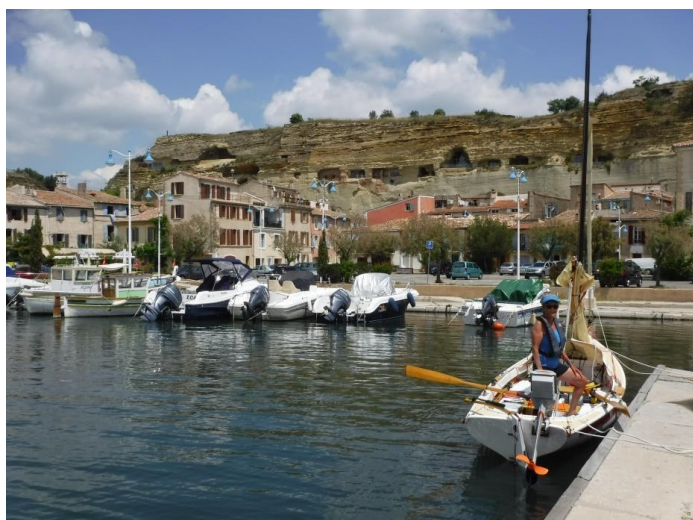
Le port du Pertuis, au pied des habitats

Ce port n'est pas ouvert à la plaisance, mais y entrer en voile-aviron c'est remonter dans l'histoire maritime du lieu !