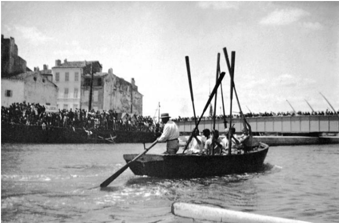
Les rameurs de jadis...

A noter par ailleurs l'existence à Martigues d'une pratique de l'aviron à banc fixe traditionnel ! Voir : http://www.lesrameursvenitiens.com/