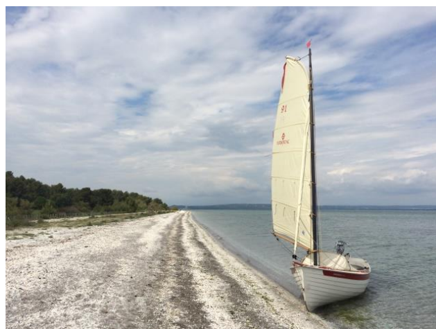
Les Hauteurs de Saint-Mitre-les-Remparts