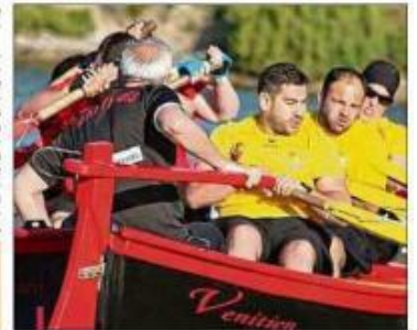
Les rameurs vénitiens dominent la compétition depuis 2013. (F. J. / 131)

LE CLASSEMENT PRÉVISIONNEL Hommes : 1. Martigues, 2. Martigues, 3. Cros de Cagnes Femmes : 1. Martigues, 2. Collioure, 3. Sièze Mixte : 1. Martigues, 2. Cros-de-Cagnes, 3. Grassan Tamalous : 1. Cros-de-Cagnes, 2. Collioure, 3. Martigues Tamalous mixte : 1. Martigues, 2. Sièze, 3. Cros-de-Cagnes Tandolètes : 1. Martigues, 2. Séignan, 3. YMoide