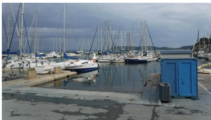
La cale du port d'Istres