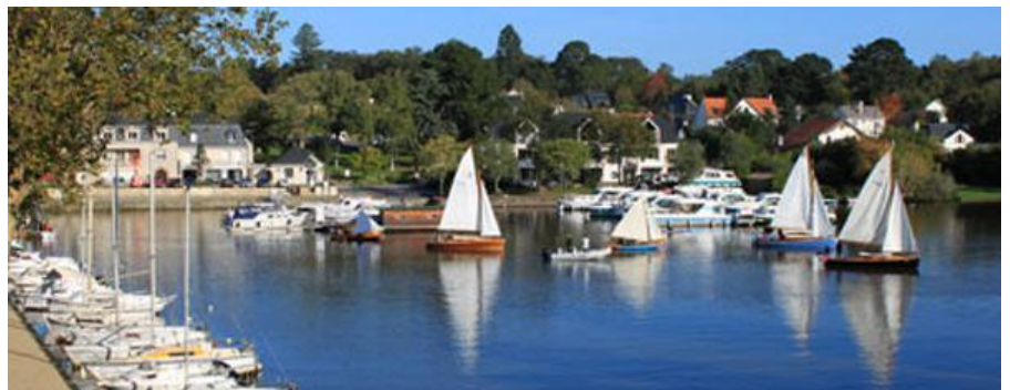
Port de Sucé-sur-Erdre.