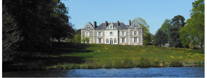
Château de Nay

De nombreux châteaux jalonnent la rivière jusqu'au pont de l'autoroute. Il existe aussi quelques ports d'escale le long du parcours, port de la Gandonnière rive droite et port St Jean et port Breton tout à côté rive gauche. Jusqu'au pont de la Jonelière, l'Erdre reste assez large, par la suite, elle se rétrécit, Nantes s'approche, l'entrée dans le port de St Félix est bordée de quais, témoins d'une grande activité passée.