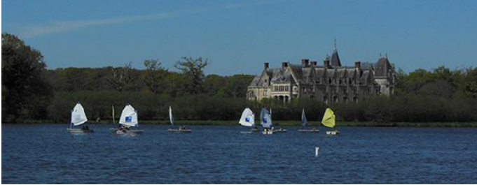
Château de la Gascherie

L'Erdre a été le siège d'une activité commerciale importante, il y avait un grand chantier et c'est aussi le départ du canal de Nantes à Brest. Aujourd'hui, c'est une très belle rivière dédiée à la plaisance, à la promenade fluviale et tout le parcours est jalonné de nombreux clubs de voile, d'aviron de compétition et de canoé-kayak.