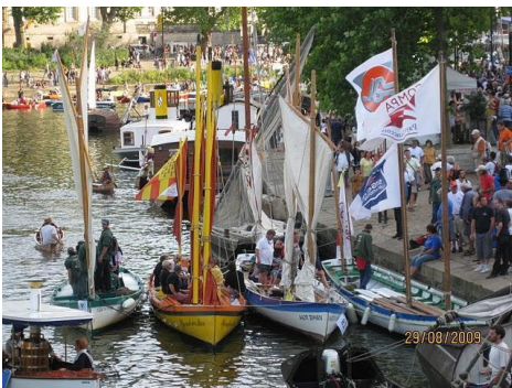
Grandes yoles à Nort-sur-Erdre.

La distance à parcourir est de 30 km, c'est une navigation décontractée sur une rivière barrée en aval par une écluse, avant de se jeter dans la Loire.