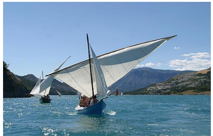
Voiles latines sur le lac.

Le niveau peut varier en fonction des besoins hydroélectriques et de régulation des crues. Il se remplit en mai-juin, est normalement maintenu suffisamment haut pendant l'été, mais baisse à l'automne.