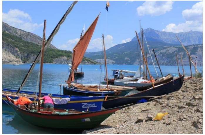
En dehors de « Voiles d'en haut », on voit rarement ce type de bateaux sur le lac.

La capitainerie du lac est située quai de la rue royale à Savines (VHF canal 14).