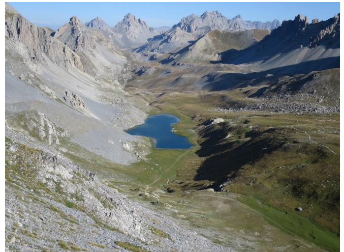
Vue sur le lac de l'Oronaye.